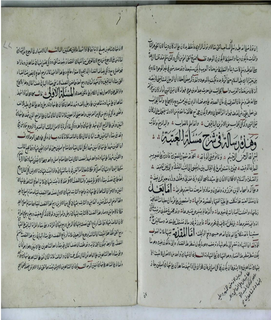
صورة الصفحة الأولى من نسخة (ب)

العنبة للعلامة الفقيه المحقق أكمل الدين محمد بن محمود الباري الحنفي (١٧٨٦هـ) - تحقيقاً ودراسة